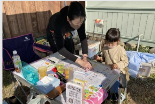
▲いぶカフェ前では己書体験やアクセサリ販売も。