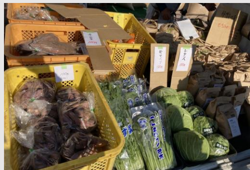
▲伊深産の野菜や米を中心に販売しました。