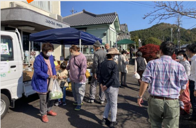
▲天候にも恵まれ、町内外から来場者がありました。

新型コロナの情勢が落ち着いてきたなか、当協議会主催による軽トラ市を11.20（土）・21（日）、旧JA前駐車場で開催し、いぶカフェ来場者などでにぎわいました。